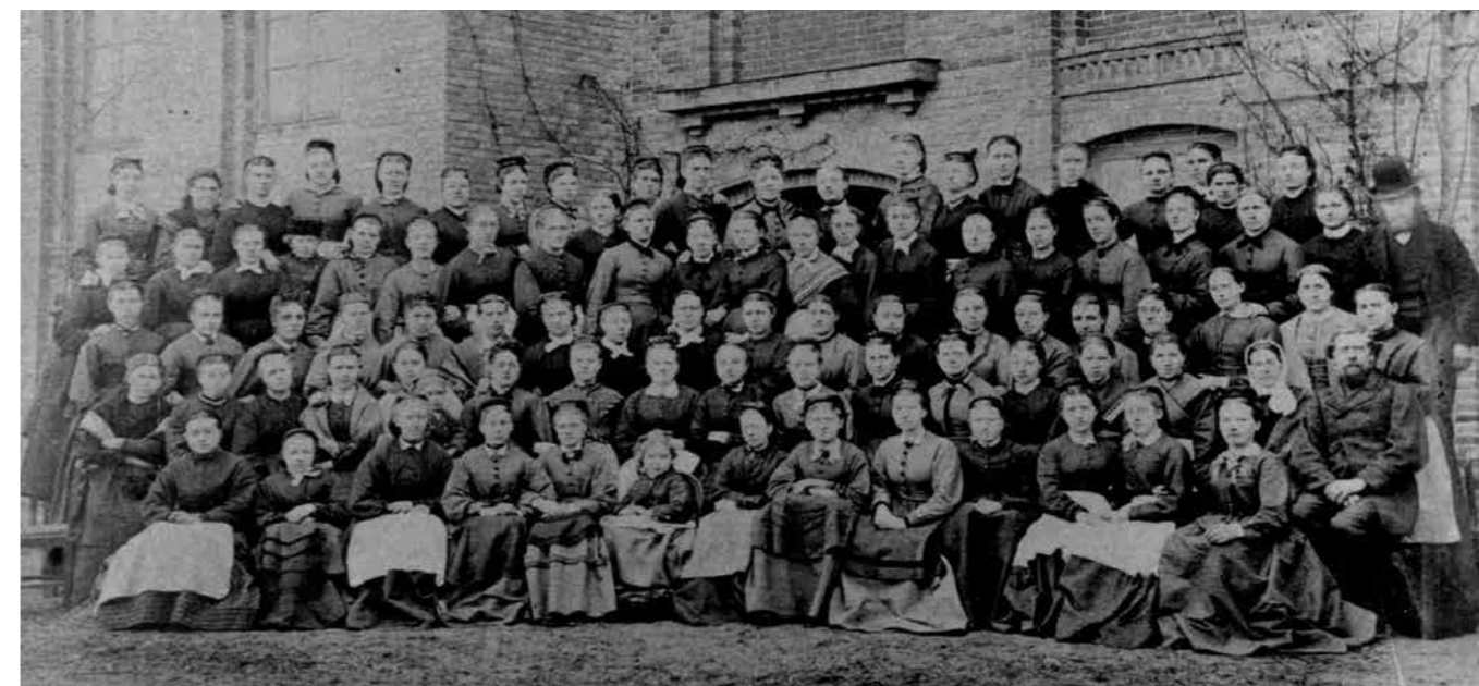
Dalum Højskole 1864. Det er Kold med bowlerhatten.

Kolds beskrivelser af skolen som den var, viser en mand på kant med autoriteterne, men som havde tidens forandringer på sin side. Efter nogle få år som ung lærer måtte han opgive at få et embede. Ingen ville ansætte ham. Kold ville ikke følge loven og undervise børnene i at kunne katekismen udenad. Det førte til en indberetning og et møde hos biskoppen i Ribe. Kold havde svært ved at overbevise sognefogeder og præster om, at børnene kunne blive konfirmerede på en anden måde: “... naar vi er i den største Nød og spørge Aanden for ramme alvor, saa svarer han os, og han sagde da til mig: