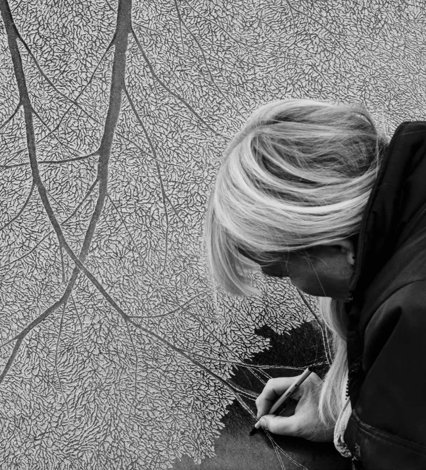
Detalje fra Kilden i Vartov

radioen. Så står jeg her og hugger og skaber det daglige brød. Det er meget meditativt for mig, og sådan har det også været at 'hugge Vartov', for det er et meget, meget enkelt mønster, jeg har hugget."