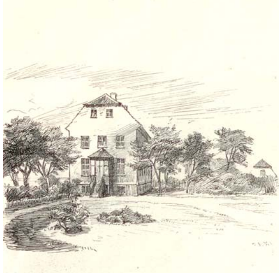
Ill. fra Mindeskrift for Grundtvig

Det blev det første i en lang række af vennemøder frem til 1898. På møderne talte Grundtvig selv og mange af vennerne. Talerne blev afbrudt af sange. Emnerne kunne være Folkelig oplysning, Det danske folk, Højskolen i Soer, Præstefrihed. Efter mødet i 1898 blev en sammenslutning af Grundtvigs venner enige om at sætte et kirkeligt arbejde i gang. De stiftede derfor i efteråret 1898 den grundtvigske forening Kirkeligt Samfund af 1898, der nu hedder Grundtvigsk Forum.